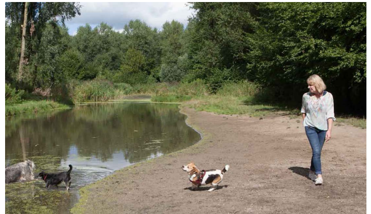
Spelen en struinen in het Purmerbos