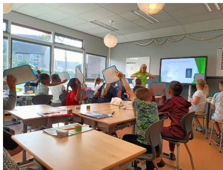
Opfrisdagen waterdrinken bij OBS Noorderlicht.

De afgelopen periode zijn op elf basisscholen in Purmerend voorlichtingen ingepland om het waterdrinken op school 'op te frissen'. Waarom drinken we ook alweer water? Hoe kan ik water lekkerder maken? Welke keuzes maak ik en hoe kan ik eten en drinken dat ik