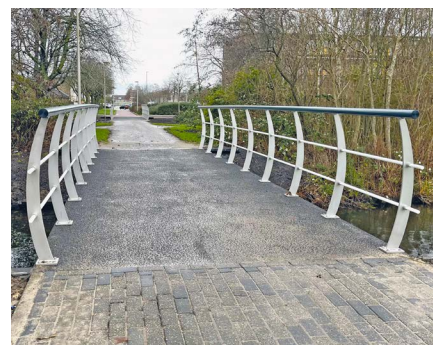
De twee nieuwe bruggen tussen de Zuidpool en het Purmerzuidlaantje.

Begin van dit jaar staat ook nog de brug op de planning die de twee delen van het winkelcentrum met elkaar verbindt. In eerste instantie wilde de aannemer deze brug al in december onder handen nemen, maar in goed overleg met de winkeliersvereniging is dit uitgesteld. Het is immers niet handig om juist in de drukste weken van het jaar zo een belangrijke brug te sluiten.