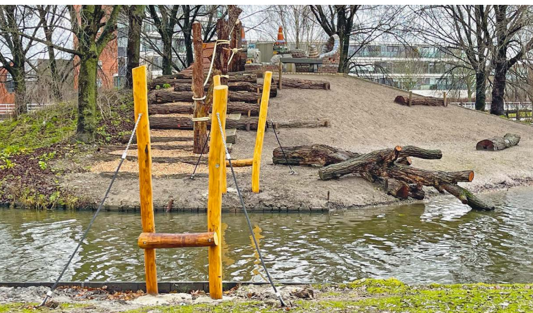
Speeleiland met de touwbrug in voorbereiding.

Aan het eind van 2022 waren de werkzaamheden bijna afgerond, en mogelijk is bij het verschijnen van deze krant alles zelfs al helemaal klaar. Op oudejaarsdag is onze verslaggever nog even gaan kijken en heeft hij onderstaande foto's gemaakt.