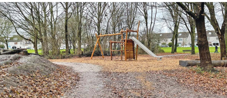
De speeltoestellen op de speelplaats zijn klaar en worden al druk gebruikt. ●