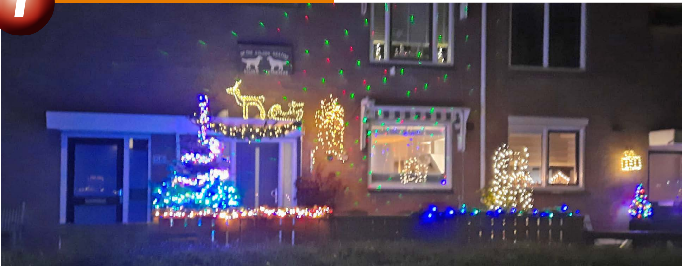
Fam. Vlaanderen Volkers