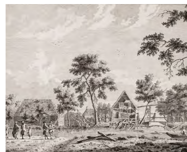
Ontploffing van kruitmakerij De Munnik in Purmerend in 1776

Op zondag 2 oktober organiseert het Waterlands Archief een Open Dag, met een programma in het kader van de landelijke Maand van de Geschiedenis. Het thema van 2022 is 'Wat een ramp!'. Dit wordt meegenomen in een gevarieerd programma rond oude archieven en rampen. Er worden enkele presentaties en workshops gegeven over paleografie en genealogie, waarin uiteraard het thema wordt meegenomen. Verder staan er rondleidingen door de depots op het programma met aandacht voor toepasselijke archiefstukken. Het volledige programma staat op de website www.waterlandsarchief.nl .