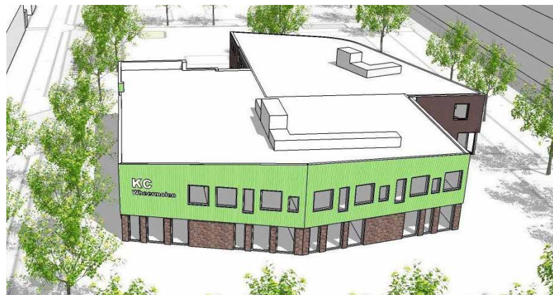
● Bouwplan van de nieuwe KC Wheermolen. ●

Voor de sloop en nieuwbouw is de gehele plek nodig als bouwterrein. Daarom is tijdelijke huisvesting nodig. Het vinden van een goede plek was een moeilijke opgave. Er werd gezocht naar een plek voor zeventien lokalen, voldoende speelruimte en genoeg plaats om fietsen te stallen. De keus is uiteindelijk gevallen op het pand aan de Mercuriusweg 2: een bestaand voormalig schoolgebouw met aula, spreekkamers en speellokaal. Na de herfstvakantie verhuizen de leerlingen naar deze plek. De verwachting is dat ze daar tot de herfstvakantie van 2022 gebruik van maken.