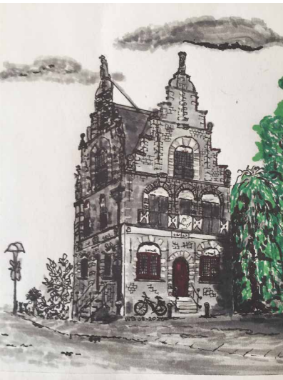
Raadhuis van Graft

Krommenie en eindigde met het begeleiden van projectmatige groepen bij Cordaan. Na zijn pensionering ging hij zich verder verdiepen in, zoals hij het zelf noemt, zijn gepriegel.