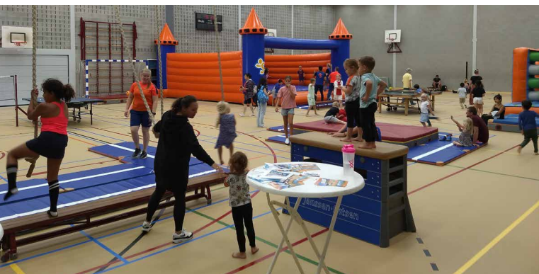
Instuif in de Kraal

Helaas is er bij het kanovaren op de momenten dat ik langs kom geen activiteit. Het slechte weer op deze momenten is waarschijnlijk de oorzaak geweest.