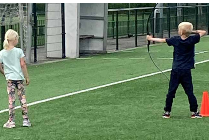
Boogschieten bij FC Purmerend

De kinderen van de Weidevenne hoefden en hoeven zich tijdens de zes weken zomervakantie echt niet te vervelen. Spurd organiseert namelijk een PurVak op drie locaties in onze wijk. De buitenactiviteiten vinden plaats op het sportpark van FC Purmerend, de binnenactiviteiten in de Brede School De Kraal en het kanovaren bij het Weidelandpad (ter hoogte van de zilveren glijbaan). Voor elke leeftijd is er wel wat te doen. Alle activiteiten vinden plaats zonder je te hoeven inschrijven. Uw redactielid wilde graag zien hoe de jeugd geniet op de diverse locaties; hieronder volgt het verslag.