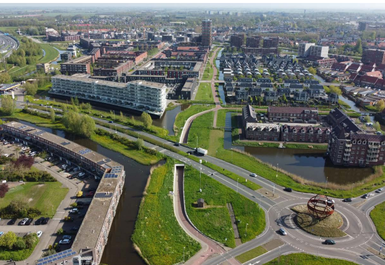
Melkweg met wereldbol

Met volgend jaar het 25-jarig jubileum van de wijk Weidevenne in het vooruitzicht besteedt de redactie in de komende wijkkranten daar extra aandacht aan. En om de artikelen te illustreren, plaatsen we geregeld een of meerdere foto's bij het artikel. En niet zo maar een foto; welnee. We hebben namelijk enkele wijkbewoners bereid gevonden middels een drone luchtfoto's te maken. Door een ander perspectief krijg je ook een andere kijk op de wijk.