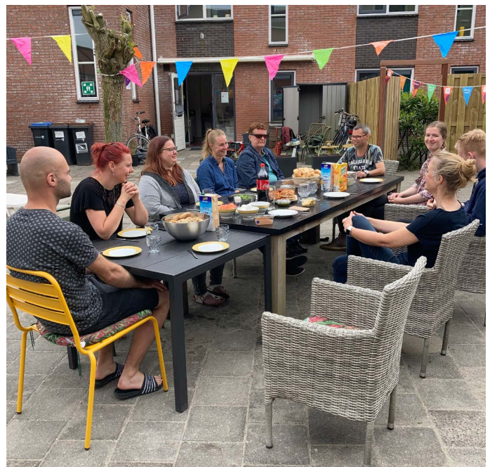
Welverdiende lunch na hard werken.

De opzet van de metamorfose was duidelijk gelukt, want de bewoners vonden het perfect. Er was een echte tuin ontstaan, die uitnodigt om er te gaan zitten na het werk, met iemand een spelletje te doen of gewoon te genieten van de zon. Overal stonden plantenbakken, zelfs op de tafels. De schutting zag er perfect uit. De bewoners beloofden de plantenbakken goed te onderhouden, zodat het nog mooier kon worden. Als dank kregen de vrijwilligers nog een attentie voor al het werk.