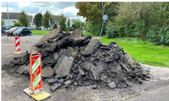
De berg oud asfalt

Het bospaadje tussen De Zuid-Pool en het Purmerzuidlaantje heeft een nieuwe bestrating gekregen.