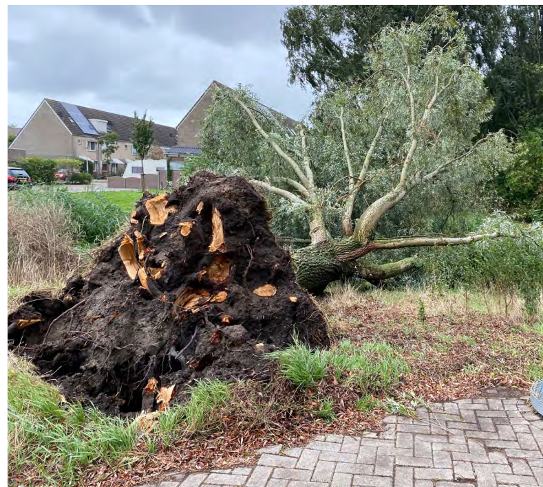
Omgevalen boom in de Bachstraat

En recent heeft de eerste zomerstorm 'Francis' ons land bezocht. De storm heeft ook in onze wijk voor schade aan bomen gezorgd.