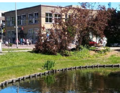
ING Bank, voormalig Distributiekantoor.