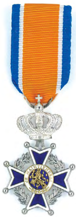
Orde van Oranje Nassau