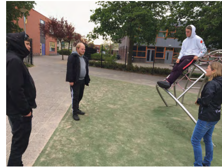
Clup in gesprek met jongeren

het echt heel goed." Ze vertelt: "Mijn collega's en ik motiveren de jeugd om vol te houden. We raden ze aan geen drukke gebieden op te zoeken, en in geval ze daar toch zijn, andere mensen de ruimte te geven. We waarschuwen ze om die anderhalve meter afstand onderling na te leven, maar ook op de grootte van de groep te letten. Het is niet onze bedoeling met de vinger te wijzen; we zijn geen handhavers, maar willen alle jongeren graag helpen deze crisis zo goed mogelijk door te komen."