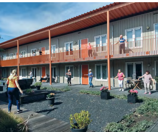
Enthousiast meebewegen met de dames van Spurd

Het is maandagmorgen en nog stil buiten. Plotseling wordt die stilte doorbroken, ik hoor muziek schallen. Het is nog in de periode dat we zo veel mogelijk thuis moeten blijven en anderhalve meter afstand tot anderen moeten houden als we wél naar buiten gaan. Ik werp een blik naar buiten en zie schuin aan de overzijde in een aangrenzende straat mensen bewegen. Aha, daar wordt gesport op muziek. Ik besluit er heen te lopen.