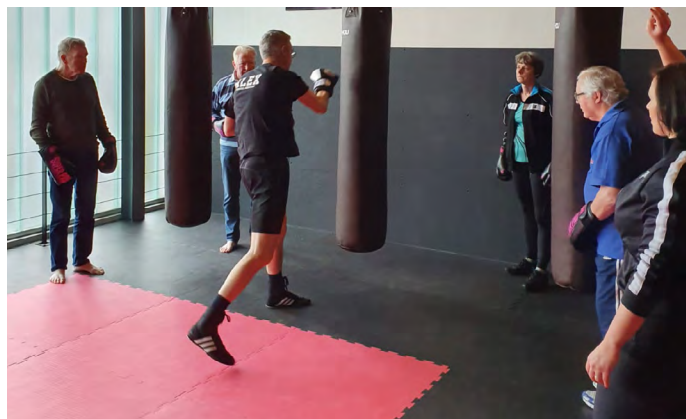
Ruim twintig belangstellenden hebben gebruikgemaakt van de voorlichting.

Over de voordelen van Parkinson-boksen kunt u van maandag tot en met vrijdag tussen 08.30 en 17.15 uur informatie inwinnen of contact opnemen met Spurd via de telefoonnummers 0299-418100 of per e-mail: info@spurd.nl . Parkinson-boksen is sinds donderdag 12 maart wekelijks mogelijk van 13.00 tot 14.00 uur, voor vijf euro per keer.