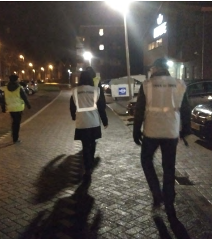
Een rondje door de wijk.

Behalve onze wijkagenten en het handhavingsteam dragen ook bewoners hun steentje bij om de veiligheid in de wijk te verhogen. Wat kunt u zelf doen?