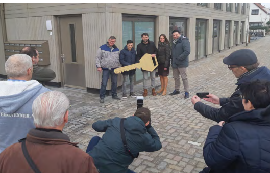
Veel belangstelling voor de overhandiging van de eerste sleutels

Er waren veel blije gezichten begin deze maand bij de sleuteloverdracht aan de eerste bewoners van de tijdelijke woningen aan de Kanaaldijk 5. Het was een mijlpaal waar heel politiek Purmerend en veel lokale en regionale pers op afkwam. Er is echter ook kritiek op de gang van zaken.