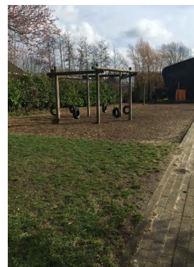
De speelplekken zijn nu nog leeg