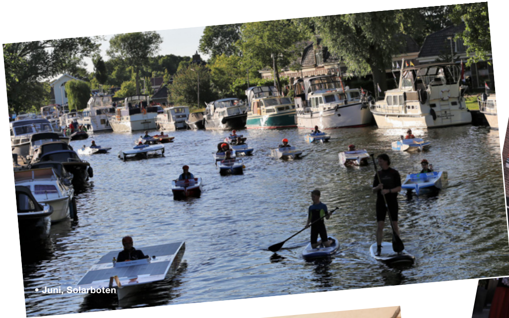
• Juni, Solarboten