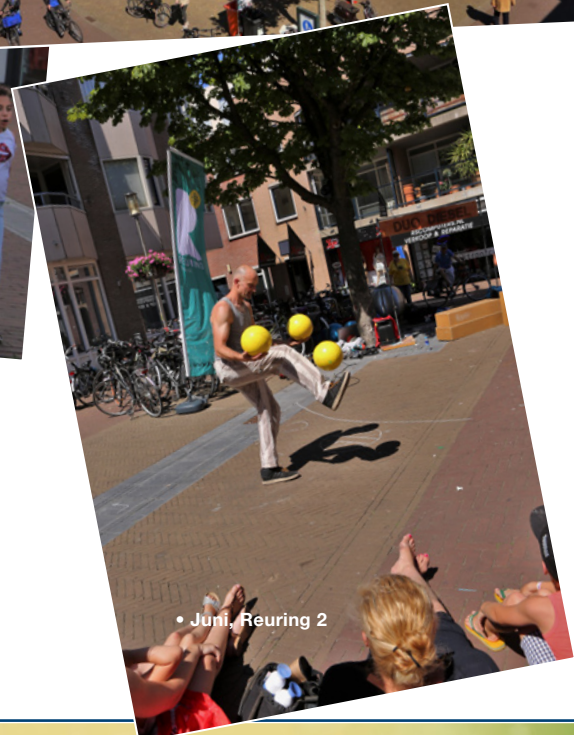
• Juni, Reuring 2