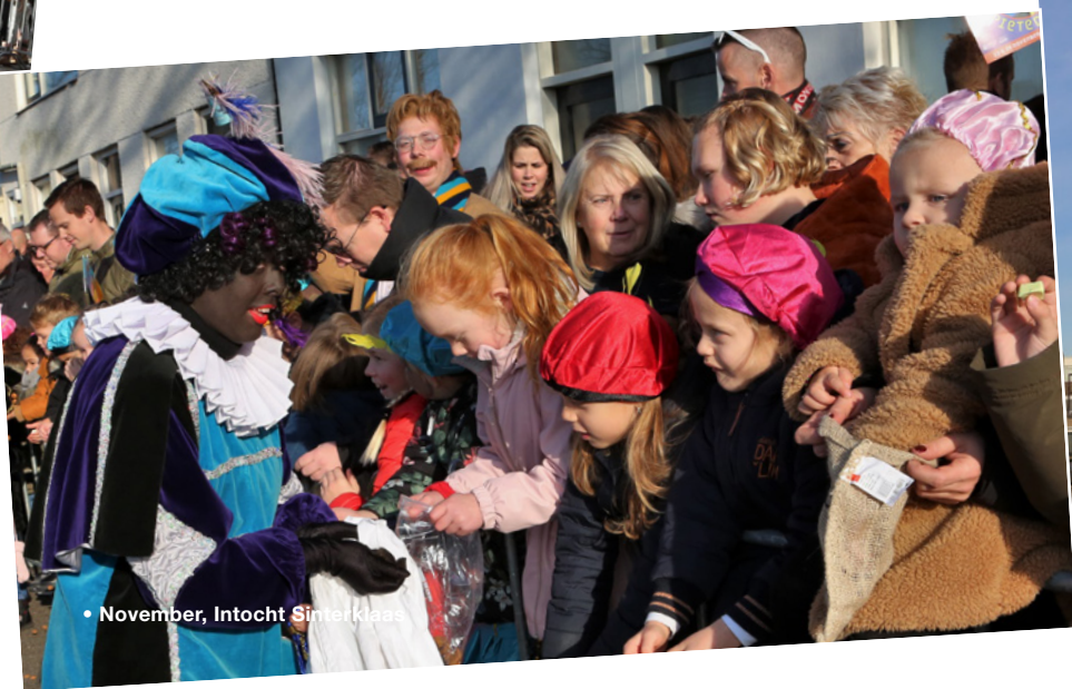
• November, Intocht Sinterklaas