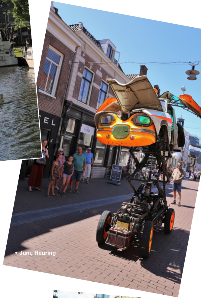
• Juni, Reuring