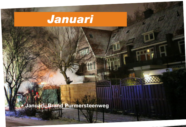
• Januari, Brand Purmersteenweg