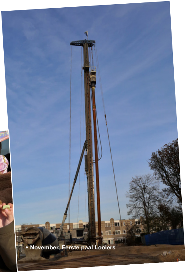
• November, Eerste paal Looiers