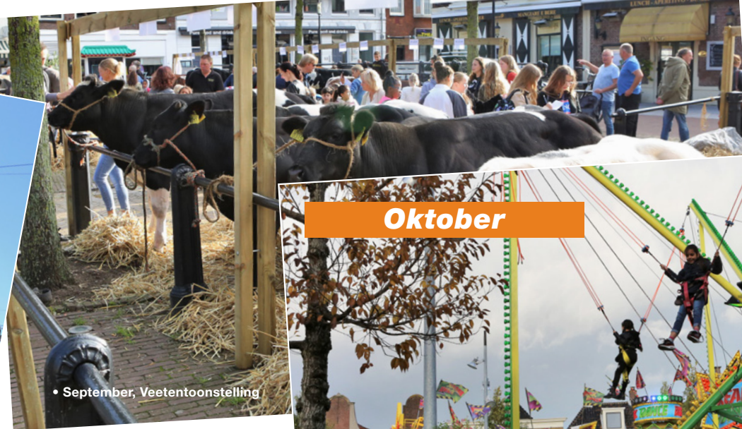
• September, Veetoonstelling