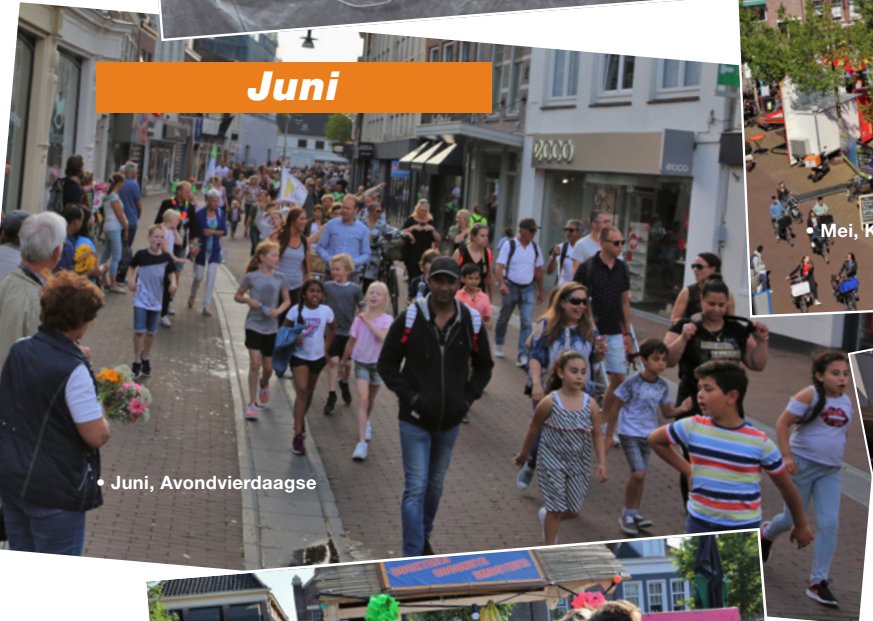
• Juni, Avondvierdaagse