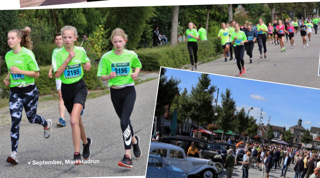
• September, Markstadrun