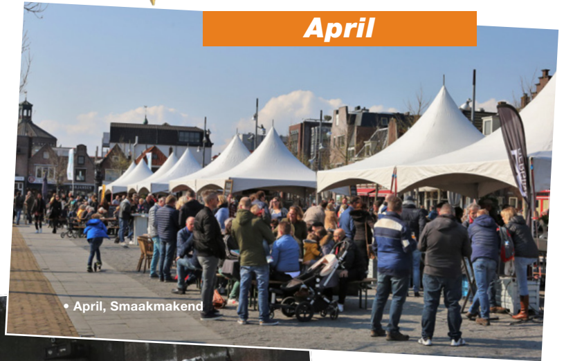
• April, Smaakmakend