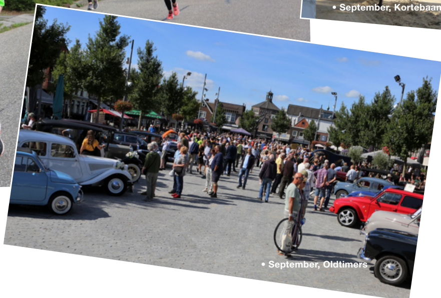
• September, Oldtimers