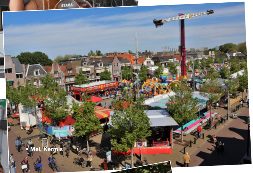
• Mei, Kermis