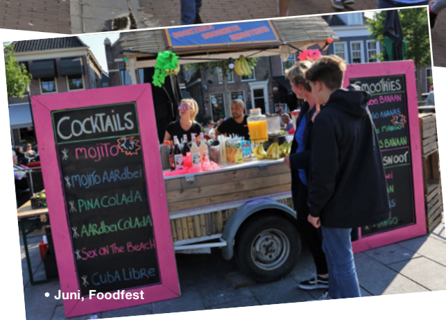
• Juni, Foodfest