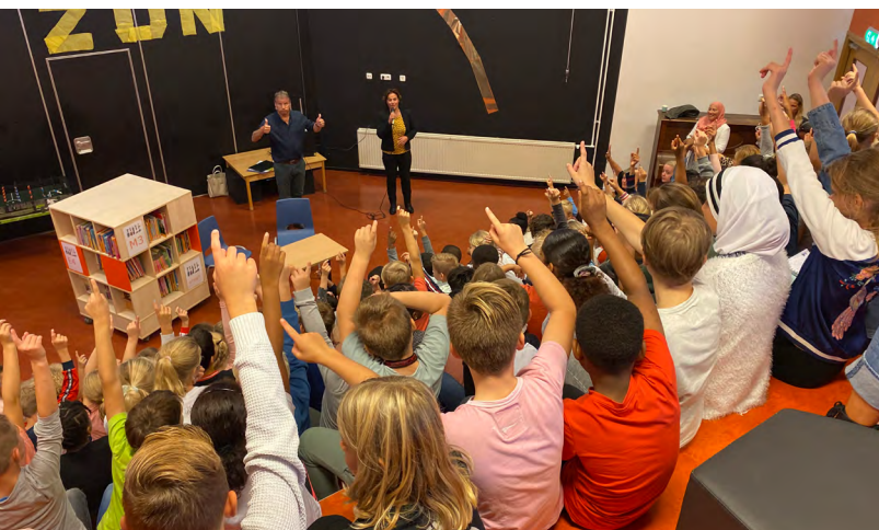
Directeur en wethouder in gesprek met de leerlingen.

Het initiatief voor dit convenant is gekomen van een buurtbewoner, die zich hard heeft gemaakt voor het realiseren van een schone schoolomgeving. Omdat dit initiatief past in het gedachtegoed van de school over zorgvuldig omgaan met de aarde, is dit direct ondersteund door de directie.