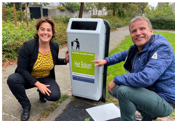
De wethouder en de directeur hebben de eerste sticker op de vuilnisbak geplakt.

Het Baken is de eerste basisschool met zo'n convenant in Purmerend. Bijna alle middelbare scholen in de stad hebben dit al gedaan. Tijmstra is blij met de ondertekening: