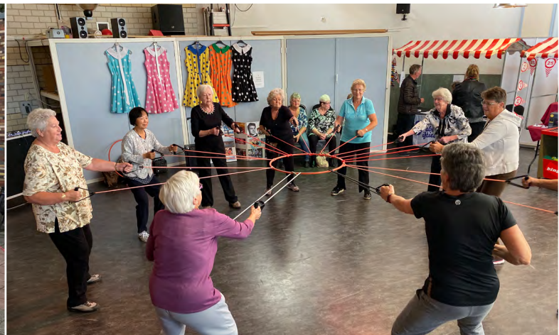
Demonstraties van de activiteiten.