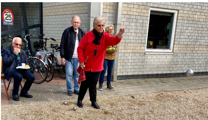
Jeu de boules club.

stelling vanuit nieuwe generaties. Veel belangstelling zagen we bij de presentaties van de kinderopvang, het rock- & roll dansen, de kinder-EHBO, tai chi, et cetera.