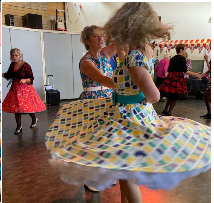
Rock en roll club swingt er op los.