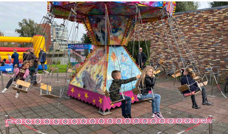
De jeugd weet het wijkcentrum te vinden.