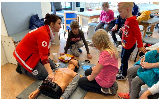
Workshop reanimatie voor de jeugd.