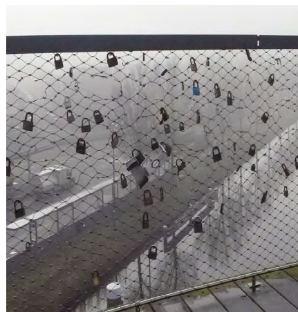
Liefdesslotjes worden soms weggehaald.

Reacties of tips? Mail dan naar koos.van.lunteren@gmail.com