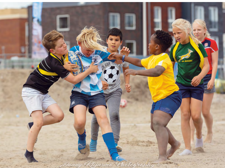
De kinderen van Rugby Club Waterland in training.

Naast de binnentuin van wooncomplex de Woonstate aan de Karavaanstraat heeft de gemeente onlangs een vissteiger laten plaatsen. Dit komt voort uit een succesvol initiatief van de bewonerscommissie W.C.J. Pastoors. Liefhebbers kunnen daar sinds kort dan ook fijn een hengeltje uitgooien.