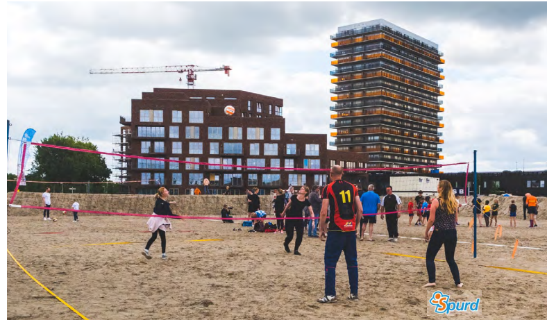
Lekker volleyballen in de wijk.

Tijdens de zomer houden veel sportverenigingen een welverdiende zomerstop. Hierdoor kunnen sporters even op adem komen. Voor sporters in Weidevenne was dit niet per definitie het geval. Op een braakliggend terrein in Kop West werd een geweldig beachveld gerealiseerd door SPURD, de ontwikkelaars en de gemeente, waar fanatiek werd gesport. Diverse sporten werden beoefend, zoals beachvoetbal, beachvolleybal en zelfs rugby. Door deze activiteiten ontstond een mooie verbinding tussen de huidige bewoners van Weidevenne en de nieuwelingen van Kop West. Ook trokken veel bewoners van andere wijken naar het veld om even lekker los te gaan.