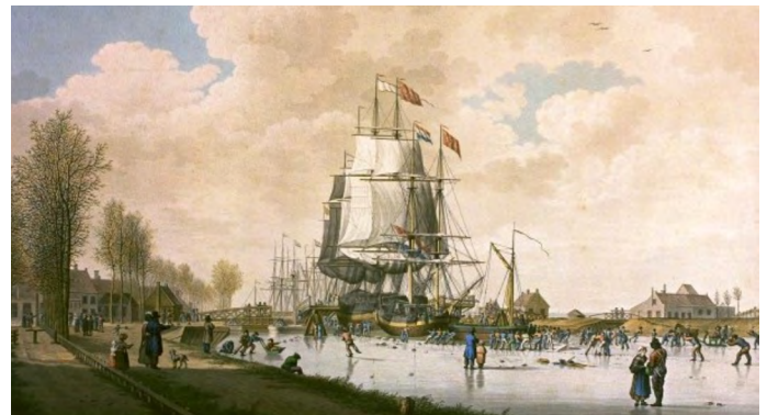
De doorrijzing van het kanaal bij Purmerend in 1830.

In opdracht van ‘Kanalenkoning’ Willem I ontwierp ingenieur Jan Blanken in 1819 een kanaal dat voldoende breed was om handels- en marineschepen naar Amsterdam te laten varen. Het immense project duurde vijf jaar en kwam na veel protest en onder zware omstandigheden voor de arbeiders tot stand.