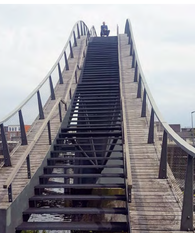
Koos boven op de Melkwegbrug.

Kijk mij nou eens genieten, boven op die prachtige Melkwegbrug! Wie had dat zeven jaar geleden gedacht? Ik was fel tegenstander van dit project. Een typisch geval van geldverkwisting vond ik het. Tweehonderd meter verderop lag toch al de Sluisbrug die Weidevenne met het stadje verbond? En waarom moest het zo'n duur, kronkelend geval worden? Nu is hij ook nog eens stuk. Ik zou er vroeger acuut chagrijnig van zijn geworden. Ik was wat je noemt een echte wijkzeiker. Ik zag overal nadelen en risico's, nooit