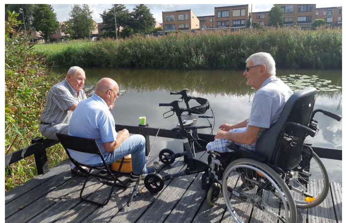
Al vanaf de eerste dag wordt de steiger goed gebruikt.

Langzaam maken we ons nu op voor het najaar. Het groen in de wijk krijgt dan op diverse plaatsen aandacht. Ook gaan meerdere bewoners van start met het adopteren van groenvakken.