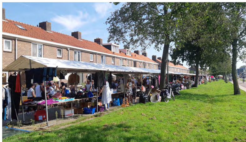
Vier lange straten met kraampjes in de Hazepolder.

Op 25 augustus was het weer een drukte van belang in de Hazepolder. De jaarlijkse rommelmarkt in dit gezellige buurtje was zonovergoten. Een perfecte ontmoetingsplaats voor bewoners die wilden ontspullen en koopjesjagers die hun slag wilden slaan.