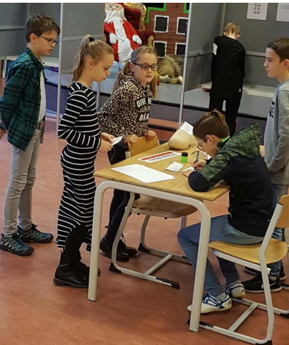
Stemmen in het stemhokje.

Ruim honderd kinderen van OBS De Nieuwe Wereld deden eind vorig jaar mee aan een project over leiderschap en verkiezingen. Leerlingen uit de groepen 7 en 8 richtten daarvoor hun eigen politieke partijen op. Zo waren er dé Sportpartij, dé Partij Voor Begrijpend Lezen, Rekenen en Elektronica (PVBLRE) en dé Partij Voor Allemaal (PVA).