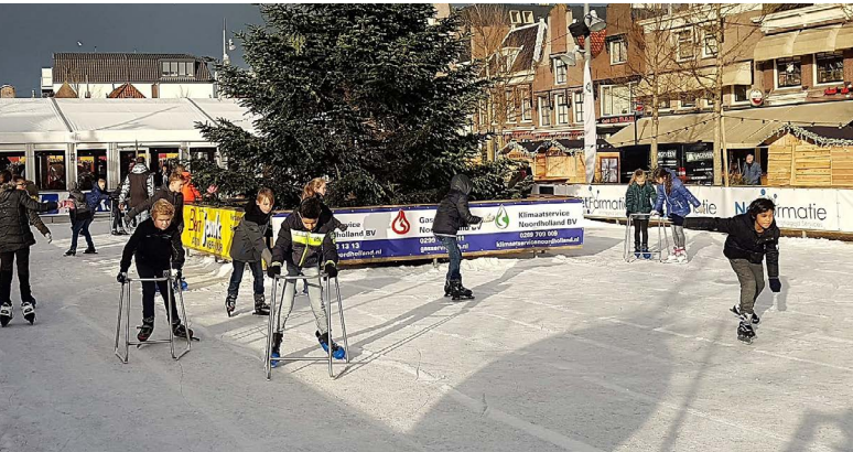
Ijsbaan op de Koemarkt 2018.