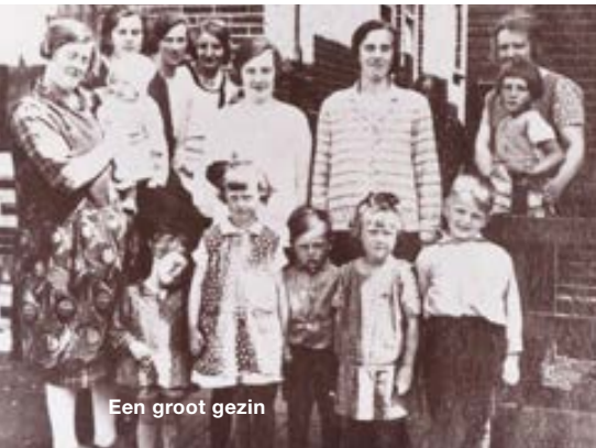
Een groot gezin

Bent u benieuwd naar uw voorouders? Wie ze waren en waar ze vandaan kwamen? Als u niet goed weet hoe u dit kunt uitzoeken of bent vastgelopen in uw onderzoek, kom dan naar het Voorouderspreekuur van Waterlands Archief en NGV (Nederlands Genealogische Vereniging), afdeling Zaanstreek-Waterland.