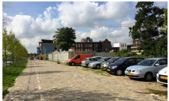
De locatie aan de Kanaaldijk.

De plek heeft al een woonbestemming en de aanbesteding voor de bouw is achter de rug. De woningen komen tegenover de sluiscolk, op grond van de gemeente. De gemeente hoopt begin 2019 de bewoners de sleutel van hun nieuwe huis te kunnen geven. Hoe inwoners in aanmerking kunnen komen, wordt waarschijnlijk medio oktober bekend. ●