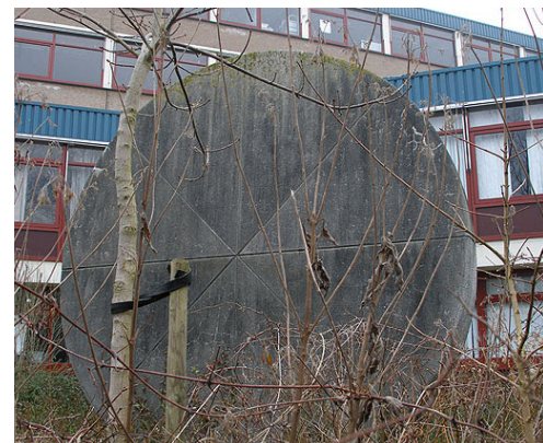
Bas Maters, Zonder titel, 1986.

Ruim twintig beeldende kunstenaars uit Purmerend en omgeving exposeren op zondag 4 maart tussen 12:00 uur en 16:30 uur hun werk in de Kerkhofgalerie en beeldentuin op de Overweerse polderdijk. Er zijn verschillende vormen van kunst te zien, zoals beelden, glas, keramiek, schilderijen, sieraden en meer. Ook zijn er kunstkaarten te koop. De kunstenaars zijn zelf aanwezig en vertellen u graag over hun werk. De toegang is gratis en kinderen zijn ook van harte welkom.