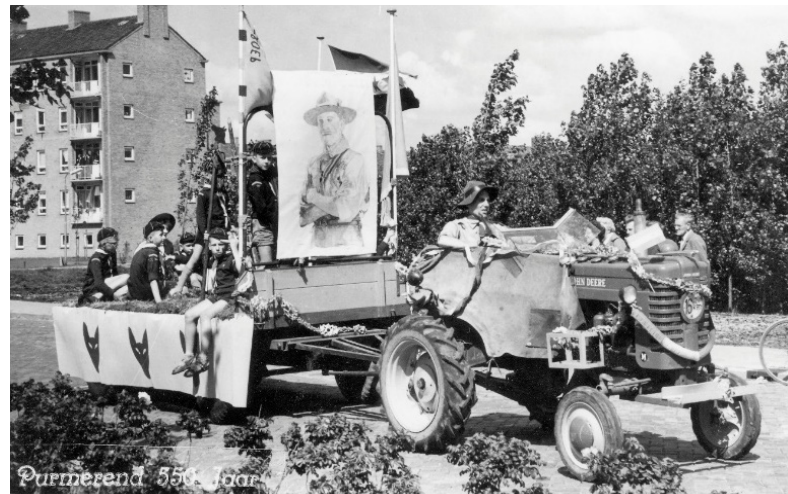
De scouting in de optocht.

Veel nieuwe bewoners van Purmerend kwamen in de nieuwe wijk terecht. Ze werden met een speciale brochure op de hoogte gebracht van wat er allemaal te beleven was in de stad. Leuke bijkomstigheid was dat Purmerend in 1960 ook nog eens 550 jaar stadsrechten had, wat uitgebreid werd gevierd.