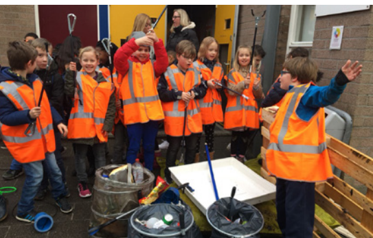
De oogst van de Carrousel.

In de laatste week van januari was het opruimfeest in Overwhere. Op maandag 22 januari gaven basisschool De Carrousel en het Clusius College de aftrap voor een week waarin in de hele wijk rotzooi werd opgeruimd. Blikjes, plastic verpakkingen, overgebleven vuurwerk en kapotte kerstballen: de kinderen gingen de troep gretig te lijf met grijpers en afvalzakken.